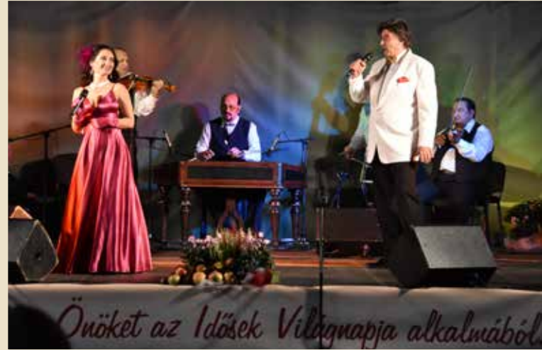
Önökét az Idősek Világnapja alkalmából

D abas egy húszéves hagyományt folytatva idén is megrendezte az idősek köszöntését az Idősek Világnapja alkalmából. Október 4-én, az OBO Aréna megtelt szépkorú polgártársainkkal, akik elfogadták az önkormányzat meghívását. Kőszegi Zoltán polgármester köszöntőjét követően a Tihanyi Vándorszínpad művészei operettelőadással szórakoztatták a közönséget. – szerk. –