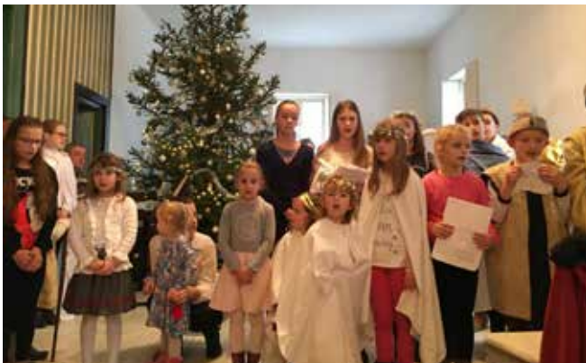
Gyermekkarácsony advent 4. vasárnapján a gyóni református gyülekezetben

Minden kedves Testvérünket szeretettel hívunk és várunk vallásfelekezeti különbségtétele nélkül!