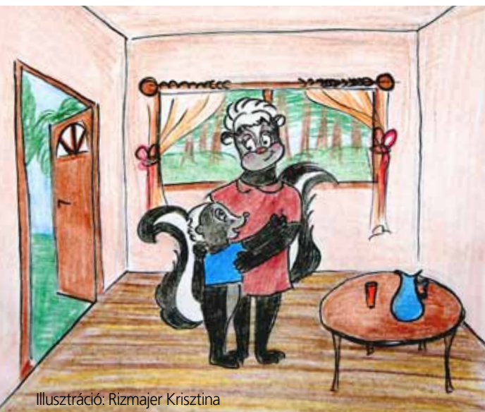
Illusztráció: Rizmajer Krisztina

– Tudod mama, lehet, hogy csikosak, mint mi, de azért én jobban szeretek borz lenni! – bújt oda mamájához Büdi egy kiadós fürdés után.