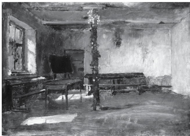
Munkácsy Mihály: Tanterem

A pályázatokban megjelöltek összevetése a mai viszonyokkal még Munkácsy Mihály ugyanebben az évben festett Tanterem című művének segítségével is nehéz feladat, de az azért bizonyossággal leszűrhető, hogy szakmai alázatból és elhivatottságból akkor nagyon sok kellett a pedagógus pályához. V. F.