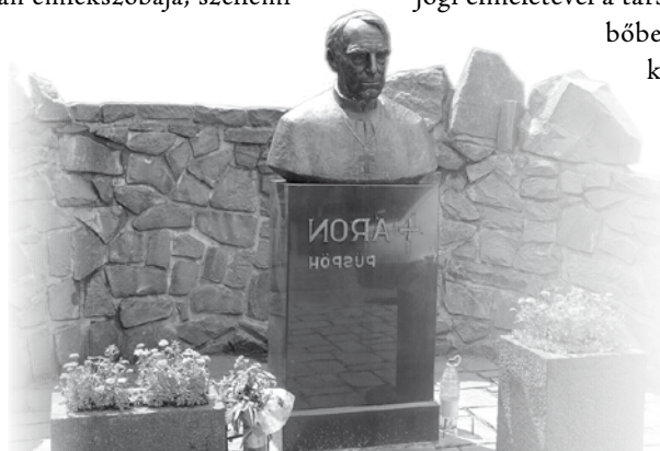
A püspök szobra Székelyudvarhelyen

(Világnézet és nevelés. Erdélyi Iskola, 1933-34. I. évf., 5-6. szám, részlet)