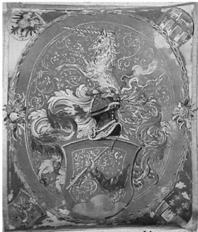
A felsővattai Wattay család 1580. évi nemesi levelének címere (Pest Megyei Levéltár)