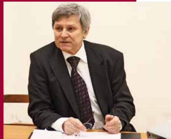
Fotó: Tomor Tamás