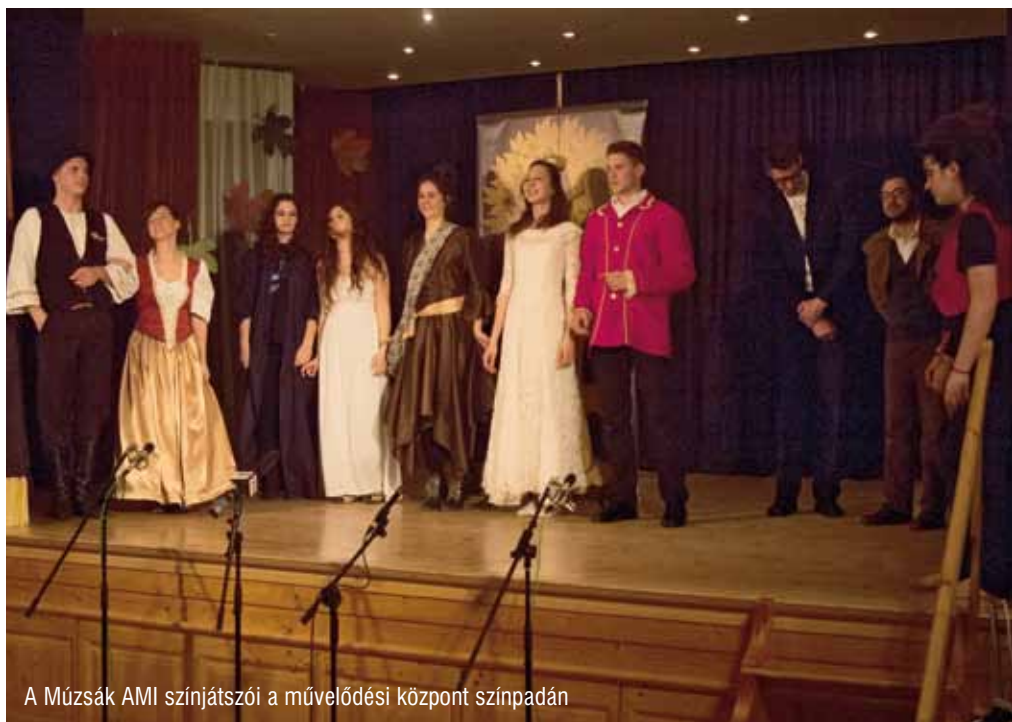
A Múzsák AMI színjátszói a művelődési központ színpadán