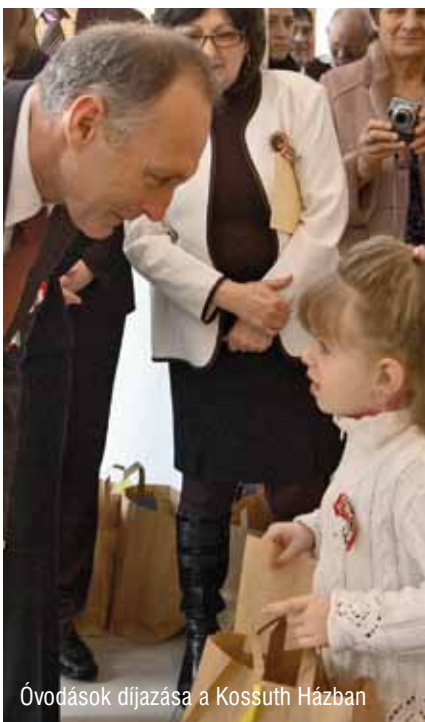
Óvodások díjazása a Kossuth Házban