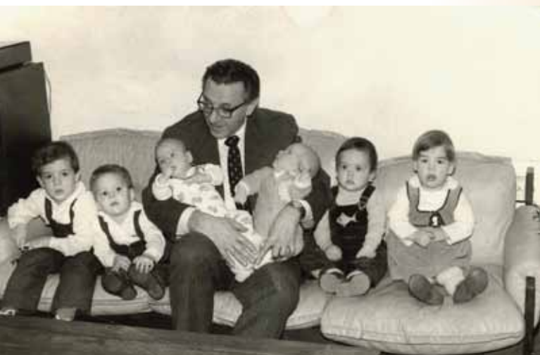
Hat unoka társaságában, akiknek száma az évek során 15-re gyarapodott