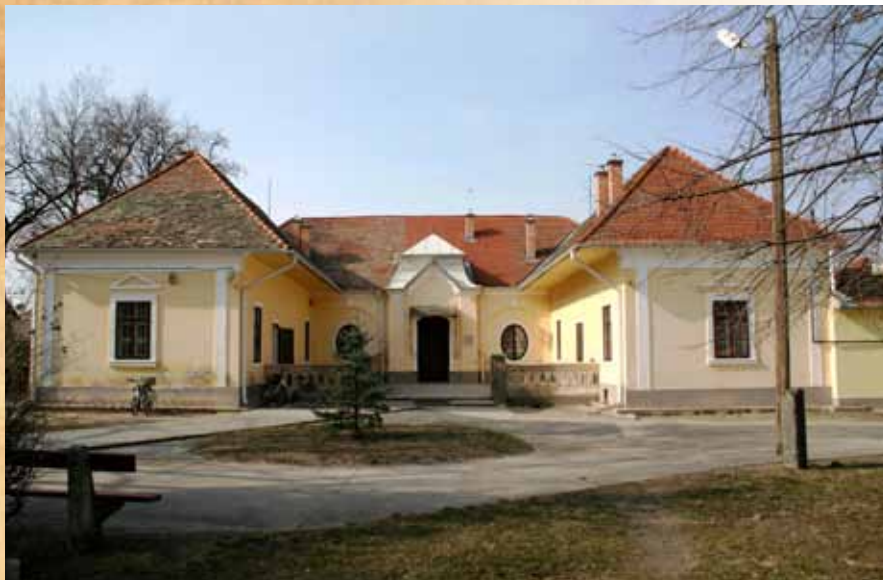
A gyóni Zlinszky-kúria

amióta a HALHATATLANOK dabasi társaságába lépett, hiányzik az ünnepeinkből. Hiányzik a hangja, megfontolt, világos, reményt adó beszédei, magas, szikár alakja, nemes arcéle, tekintélyt és alázatot ötvöző egyénisége. Zlinszky Jánossal egy generáció utolsó képviselője távozott közülünk, azoké, akik még ismerték az etikettet, az udvariassági szabályokat, a pontosságot, a türelmet, tudták az igazságot és megélték a 20. századi történelmi események poklát.