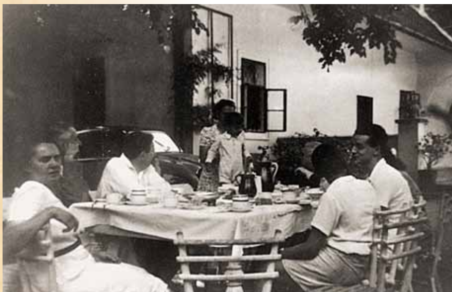
A Zlinszky család Gyóron, a nagy eperfa alatt