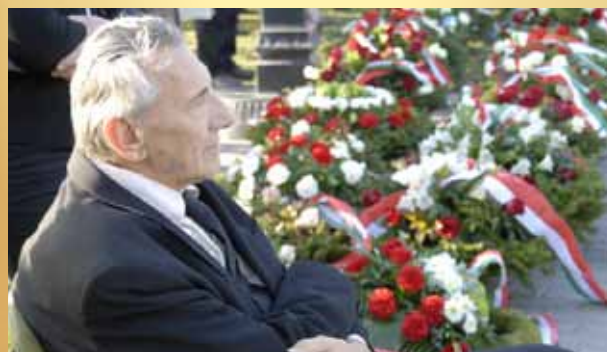
Utolsó dabasi látogatása, 2013. október 23-án