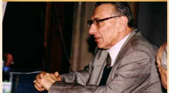
A katedránál, tanítás közben