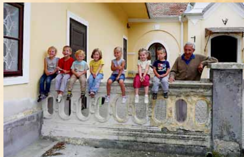
A 11. gyóni generációval – dédunokatábor 2014-ben