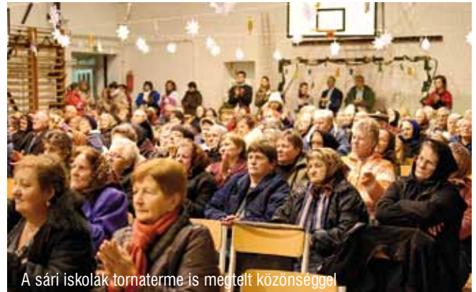
A sári iskolák tornaterme is megtelt közönséggel