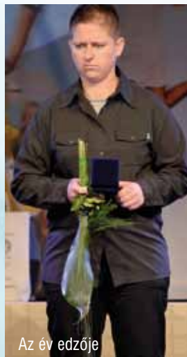
Az év edzője