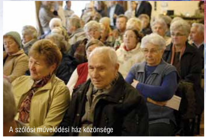
A szőlői művelődési ház közönsége

December 10–13. között négy helyszínen zajlott a karácsonyi ünnepségsorozat városunkban. Dabasi-szőlőkben, Sáriban, Dabason és Gyónon karácsonyi műsorral és ajándékkal köszöntötte Dabas Város Önkormányzata a nyugdíjasokat. A karácsonyi műsorok idén is teltház előtt zajlottak, mintegy 700 időskorú vett részt a rendezvény négy helyszínén.