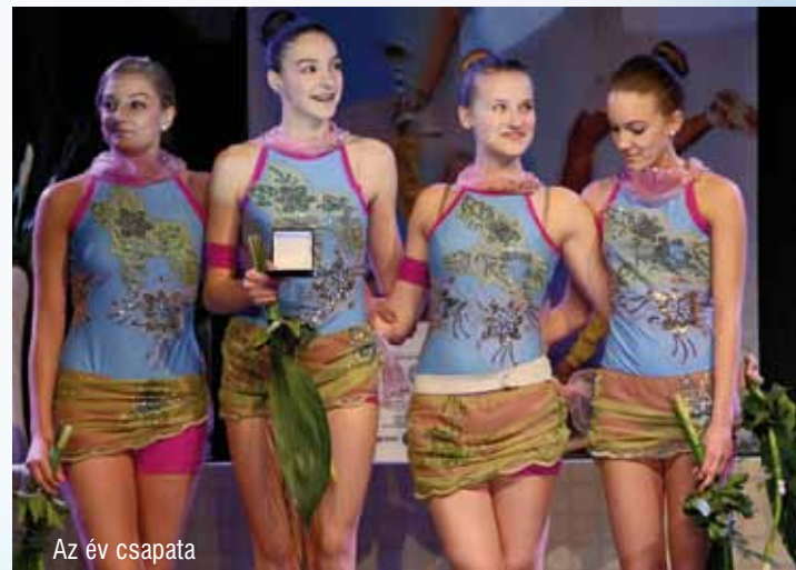
Az év csapata