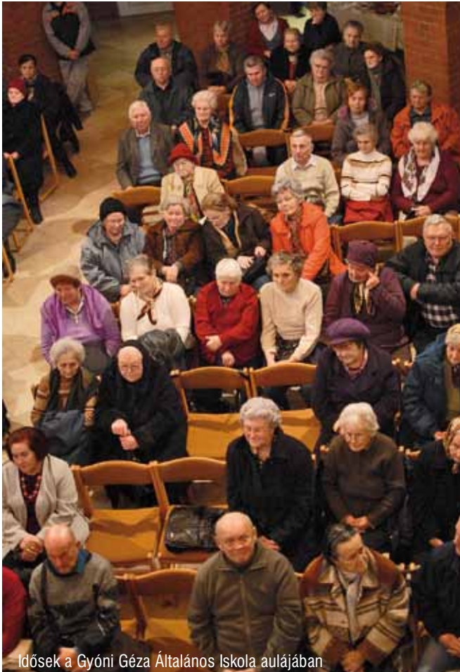
Idősek a Gyóni Géza Általános Iskola aulájában