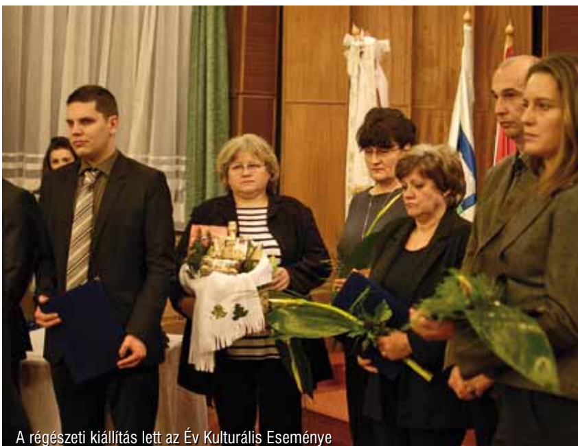
A régészeti kiállítás left az Év Kulturális Eseménye