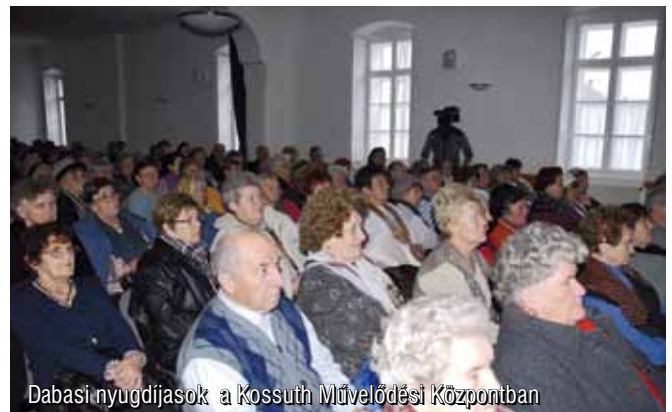
Dabasi nyugdíjasok a Kossuth Művelődési Központban