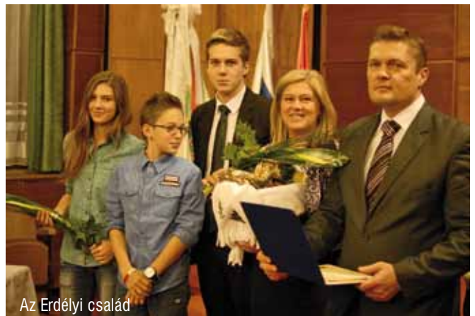
Az Erdélyi család