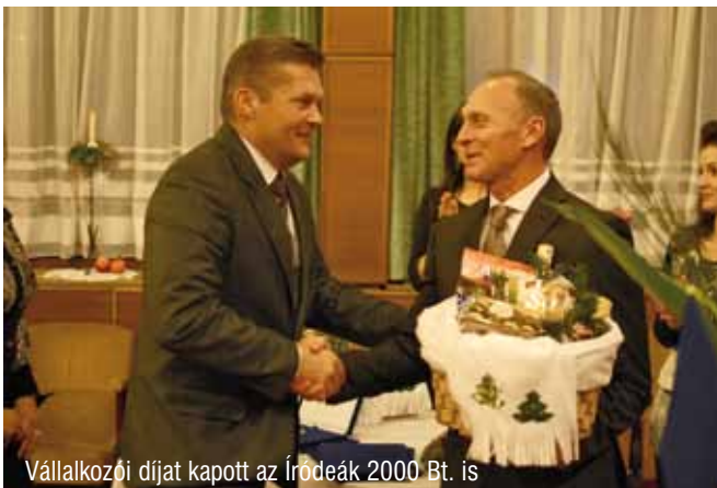
Vállalkozói díjat kapott az Íródeák 2000 Bt. is